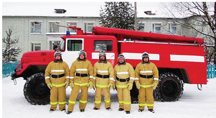
Добровольные пожарные д. Малая Липовка

В течение года, на основании «Соглашений о взаимодействии» подписанных с органами местного самоуправления сельских поселений, организовано 48 территориальных подразделений добровольной пожарной охраны в 19 муниципальных районах области, общей численностью 205 человек (см. табл. 1).