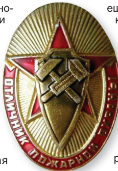
Нагрудный знак «Отличник пожарной охраны», СССР, 1970-1991 г.г.